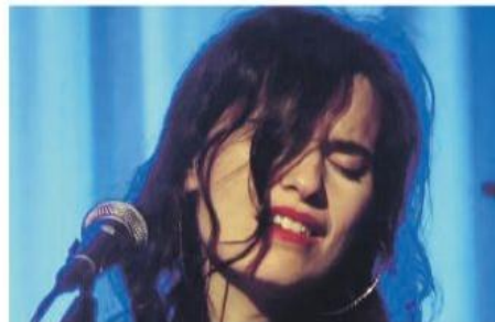
ECLETTICA Erica Mou

Avvezza ad esperienze creative di vario genere (musica, cinema, teatro, letteratura) Erica Mou è al lavoro per l'uscita del suo nuovo album e la pubblicazione del suo nuovo romanzo.